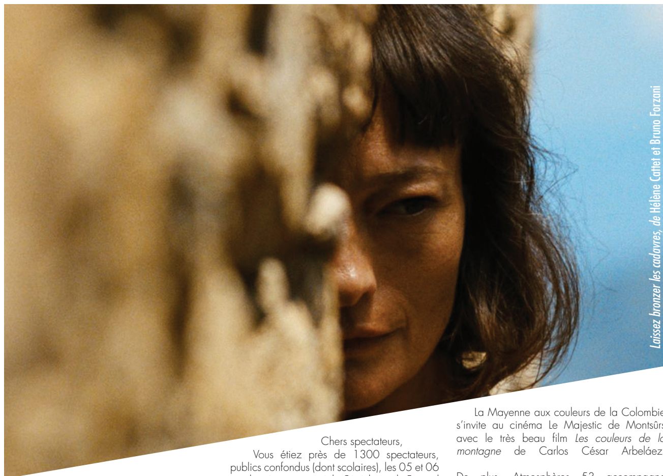
Laissez bronzer les cadavres, de Hélène Cattet et Bruno Forzani